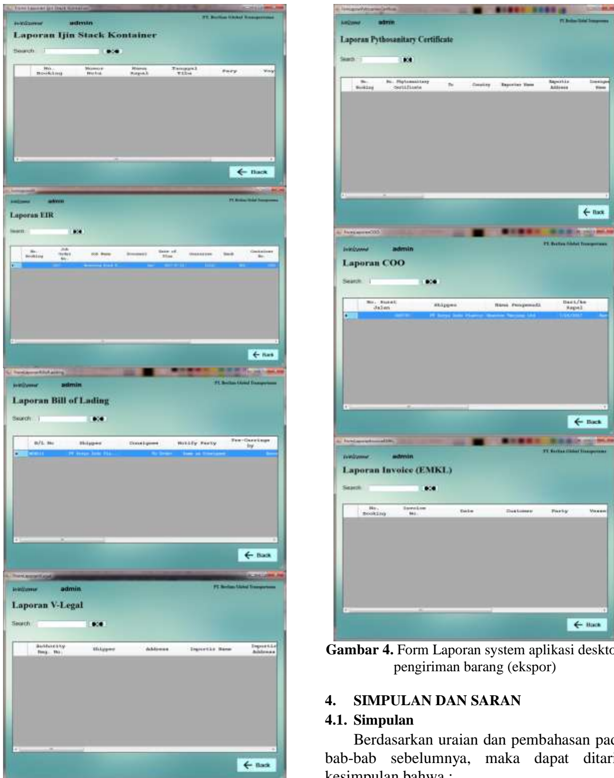
Gambar 4. Form Laporan system aplikasi desktop pengiriman barang (ekspor)