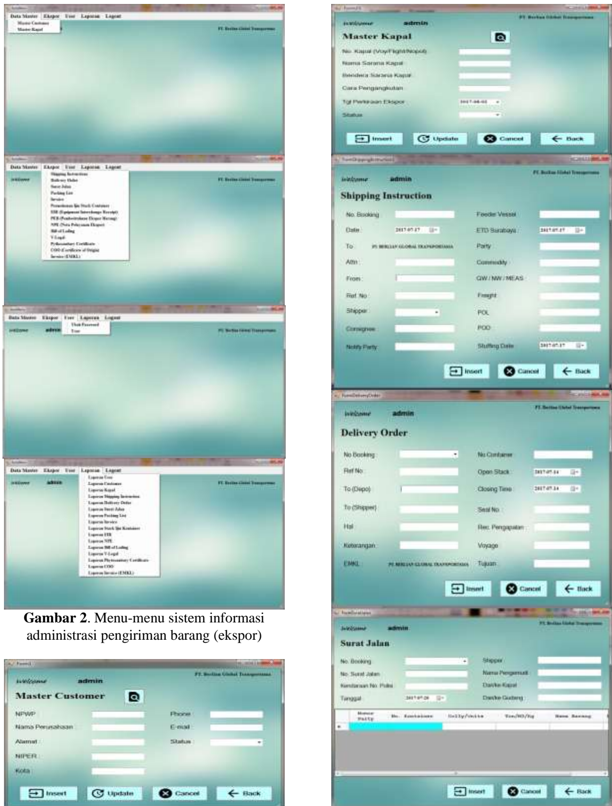
Gambar 2. Menu-menu sistem informasi administrasi pengiriman barang (ekspor)